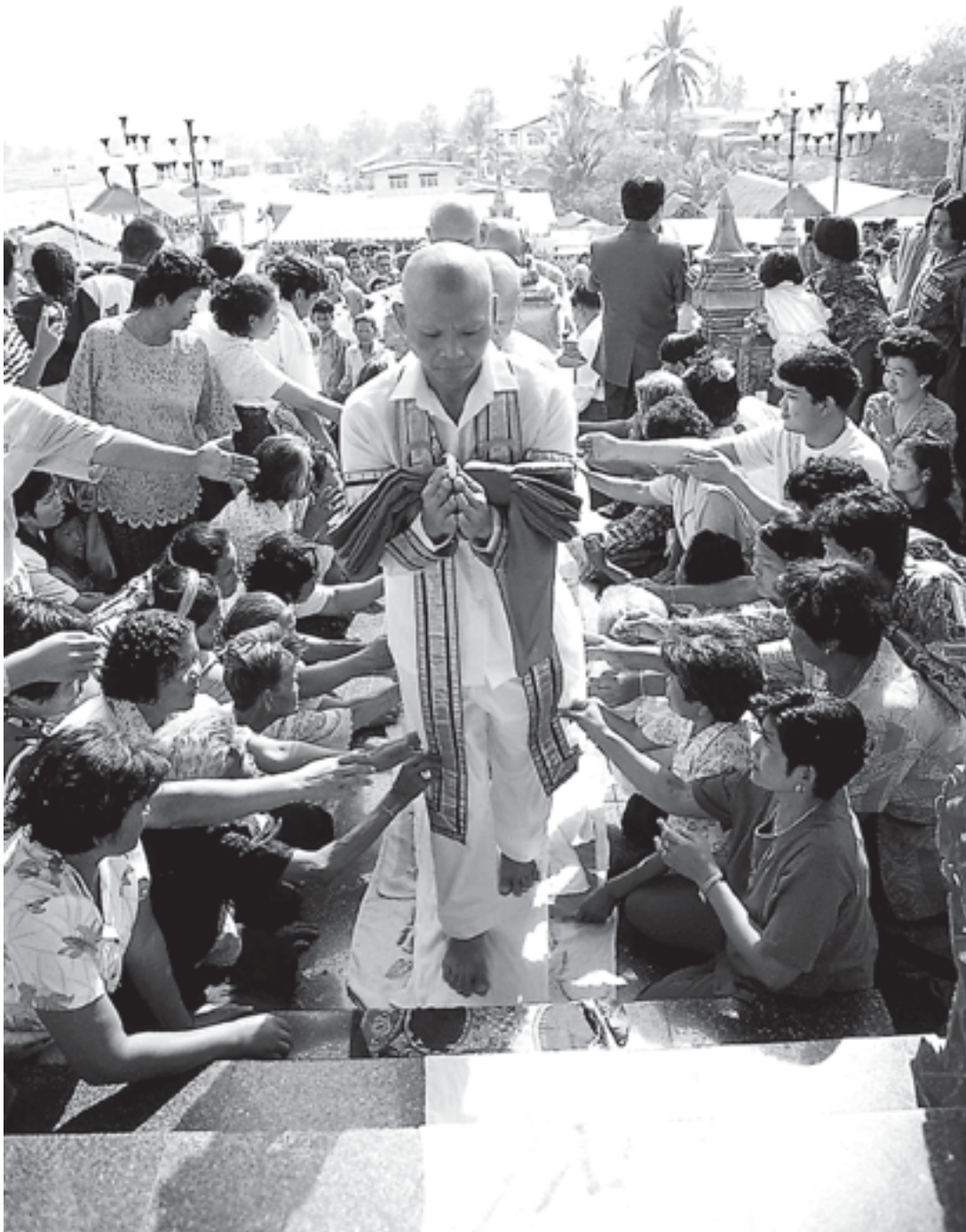
นาคกำลังเข้าพิธีอุปสมบทในพระอุโบสถ