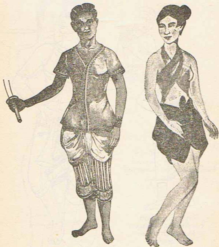
เครื่องแต่งกายชายและหญิง สมัยอยุธยา เขียนเลียนแบบภาพจิตรกรรมในสมุดไตรภูมิ สมัยอยุธยา

Costume of a man and a woman Ayudhya Period.