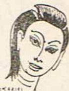
ทรงผม จากทนต์เพื่อพระมาลัย สมัยอยุธยา พ.ศ. ๒๓๐๔ ในรัชกาลสมเด็จพระที่นั่งสุริยาศน์อมรินทร์ ปีที่ ๑๒๔ หอสมุดแห่งชาติ ๒๒/๑๑/๑๐