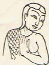
ทรงผม จากรูปสลักไม้ จรรยาทัศน์ วัดโพธิ์เชือก